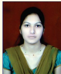
ભૂમિકાબેન ડી.મોદી ક્લાર્ક